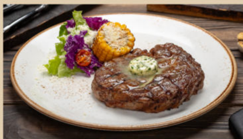
ФИРМЕННЫЙ РИБАЙ СТЕЙК «СИНДИКАТ»